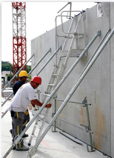
mise en place rapide