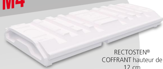
RECTOSTEN® COFFRANT hauteur de 12 cm