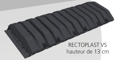
RECTOPLAST VS hauteur de 13 cm