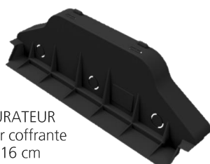
OBTURATEUR hauteur coffrante de 16 cm